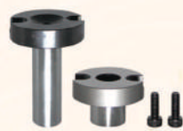
Sprue Bushings 灌嘴