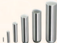
Dowel Pin 定位銷