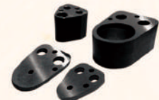
End Retainer Sets 固定座組