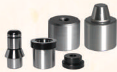
Tapered Pin Sets 錐度精定位銷組件