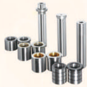
Guide Pin and Guide Bushing 卸料板導柱套