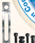
Tension Link 張力環