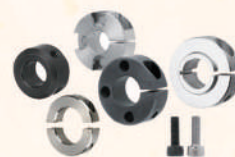
Set Collars with Setscrew 固定環