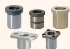
Bushings for Locating Pin 定位銷用襯套