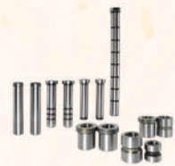
Precision Leader Pins 塑模用精密定位導銷