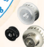
Timing Pulley 皮帶輪