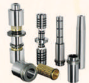
European/American Standard 歐美規格