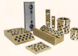
Oil Free Series 無給油系列