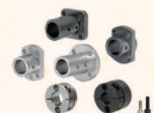
Holders for Shaft 導桿架