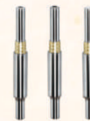
Miniature Ball Bearing Guide Sets 微型組件