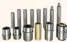
Precision Ejector Leader Pins and Bushings 精密頂出導柱套