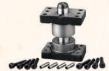
Plain Guide Post Sets 獨立導柱組