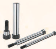
Stripper Bolts 等高螺栓